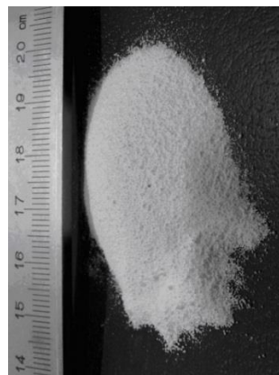
Rys. 2. Materiał zmiennofazowy Micronal DS5038X – mikrogranulat w postaci proszkowej

Fig. 1. Phase change materials Micronal DS5037X – liquid in the form of aqueous dispersion