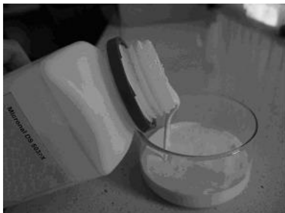
Rys. 1. Materiał zmiennofazowy Micronal DS5037X – płyn w postaci wodnej dyspersji

Fig. 1. Phase change materials Micronal DS5037X – liquid in the form of aqueous dispersion